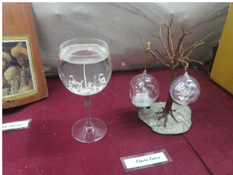
Flavio Turco Premio "Creatività"