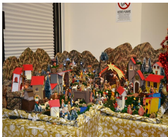
Casa Soggiorno C.G. Breciani – 3° Piano III° Premio con Diploma