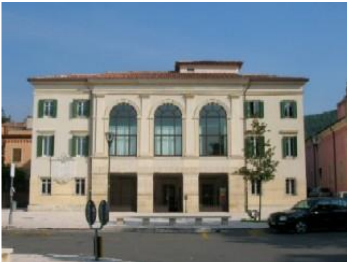
La Sede della 2 a Circoscrizione in Piazza Angelo Rigetti, 1 – 37125 Quinzano Verona