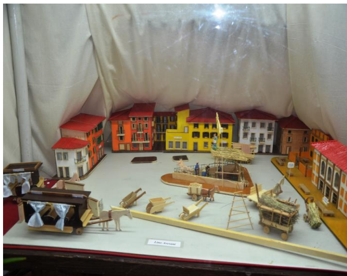
Lino Avesani Premio "Composizione"